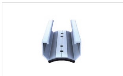
Mostek krótki C33