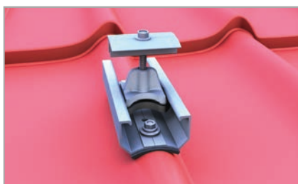
Kłemu w mostku krótkim C33