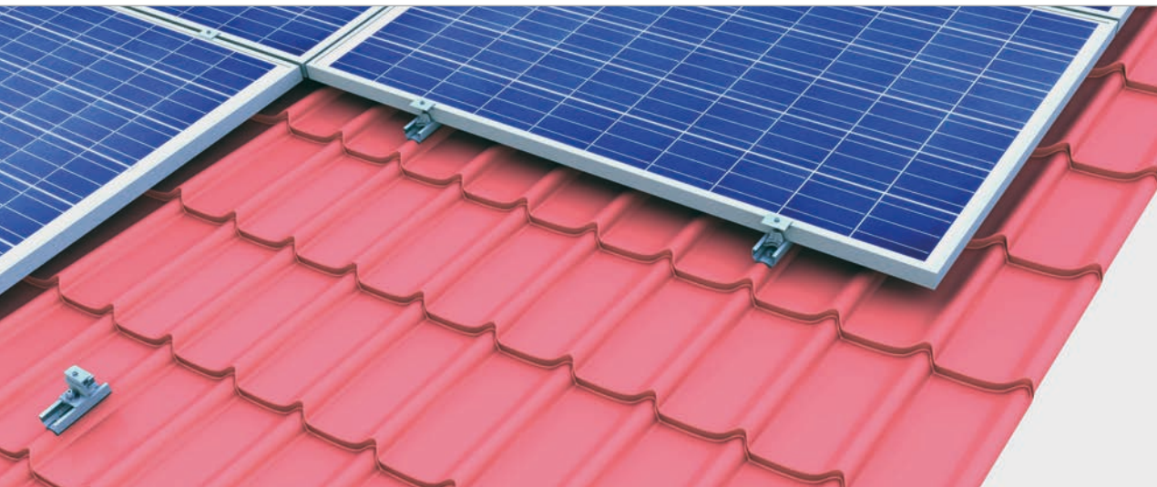
System zaciskowy z montowanymi poziomo modułami do blachodachówki