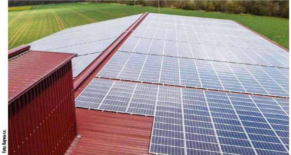
Dach warstwowy w całości pokryty modułami fotowoltaicznymi

Nośności na wrywanie wkrętów zgodnie z aprobatą nadzoru budowlanego są pomniejszone o materiałowe współczynniki bezpieczeństwa i skutkują tzw. wartościami znamionowymi do obliczeń statycznych. W przypadku blachy stalowej o grubości 0,5 milimetra śruba ma wytrzymałość na rozciąganie wynoszącą Z_{Rd} \sim 0,6 kiloniutona. Oznacza to, że obciążenia wymienione w przykładzie można łatwo wprowadzić do płyty warstwowej za pomocą wybranej liczby śrub.