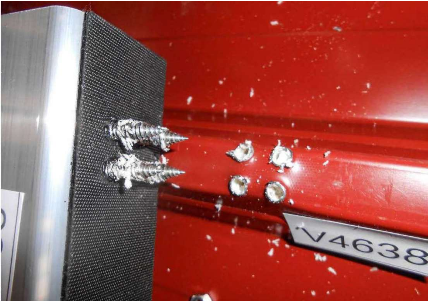
Specjalne wkręty stożkowe do trapezu, robią w blasze lejek – śruba trzyma się na 2-3zwojach.

Pokrycie dachów budynków komercyjnych, przemysłowych i rolniczych płytami warstwowymi stawia instalatorów fotowoltaiki raz po raz przed wyzwaniem: czy mogą przymocować bezpośrednio do arkusza pokrycia warstwowego, jak to zwykle bywa w przypadku blachy trapezowej, czy raczej nie? Poniższy artykuł przedstawia wyniki badań Baywa r.e. Solar Energy Systems GmbH.